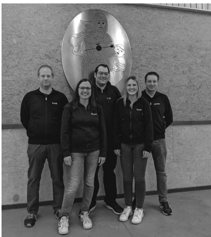
Unsere Aufsteiger in die Bezirksliga