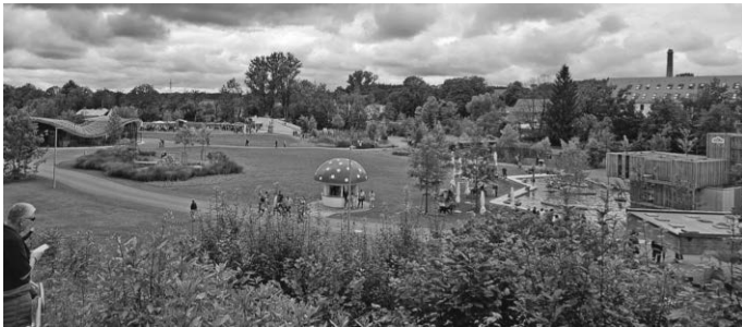
Die Argenwiese auf dem Landesgartenschauengelände

Die Argenwiese auf dem Landesgartenschauengelände bietet ein einmaliges Ambiente dafür. Der Partnerschaftsverein freut sich auf ein paar gemütliche Stunden in geselliger Runde.